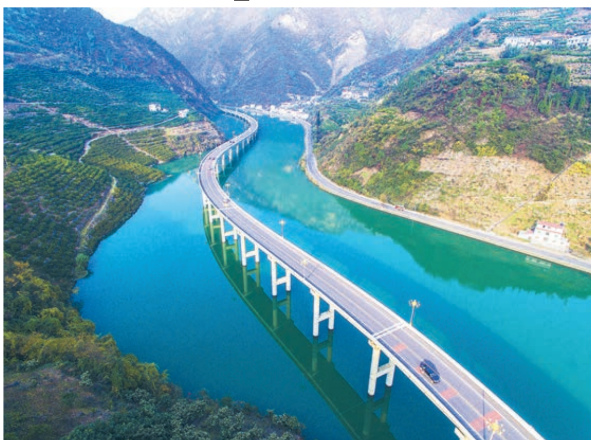
Судьба страны – в лицах людей, деталях быта и даже в пейзажах.

Эти грандиозные изменения в жизни КНР отразились даже в китайском языке, одном из древнейших и консервативных в мире. Можете спросить пожилых китайцев, которые помнят голдные времена, когда чашка риса на обед была главной жизненной заботой и тревогой. Они скажут, что тогда и приветствовали друг друга совсем