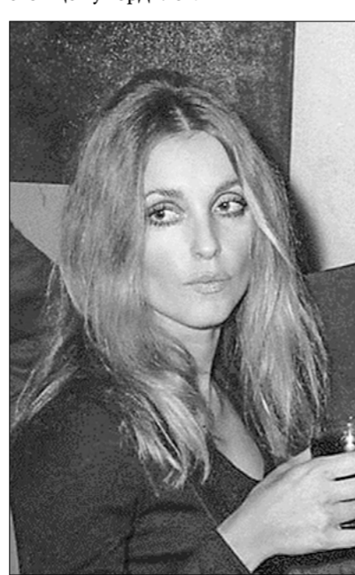
Режиссёр Роман Полански с актрисой Шерон Тейт и Эрве Базен с супругой на премьере фильма Полански «Бал вампиров». Париж, 31 января 1968 года.

Важно подчеркнуть и то, что писатель верил в лучшие человеческие качества своих героев. Можно предположить, что сильными персонажами, нарисованными выпукло, восторженно и с ярко выраженными добродетелями, писатель по-настоящему гордился.