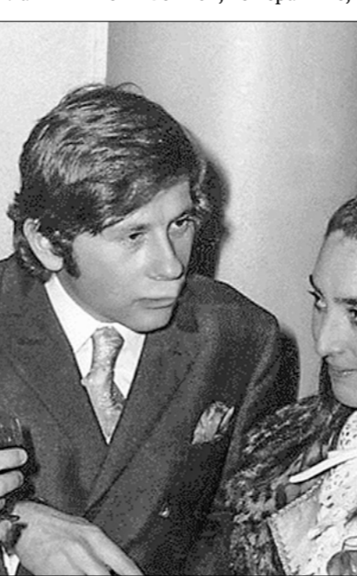
Режиссёр Роман Полански с актрисой Шерон Тейт и Эрве Базен с супругой на премьере фильма Полански «Бал вампиров». Париж, 31 января 1968 года.

Крайне поучительными представляются и мысли Констанс. Приведу одну из них: «В последнее время, в самое последнее время — но что такое время? — я штурфовала книги по живописи, по керамике,