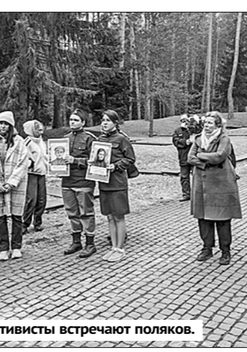
Смоленские активисты встречают поляков.

Граждане хотели узнать отношение Кшиштофа Краевского к предоставлению польского воздушного пространства украинским беспилотникам, которые атакуют Россию, а также про требования репараций за якобы