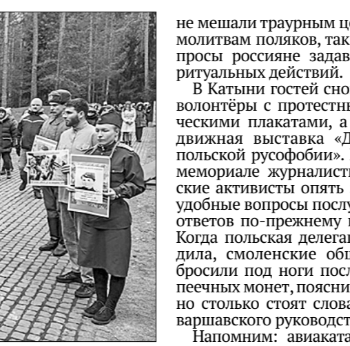
Польские активисты в Смоленске.

Однако все вопросы посол Польши и члены делегации просто проигнорировали. Важно отметить, что смоленские волонтеры и журналисты