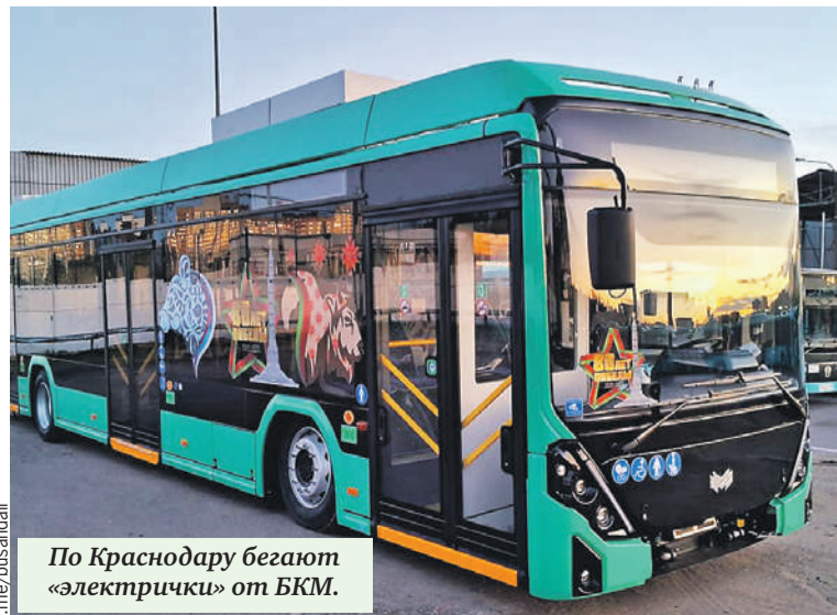
По Краснодару бегают «электрички» от БКМ.

Подводя итог: сегодня белорусские автобусы, троллейбусы и электробусы работают минимум в десятке российских регионов: от Мурманска и Санкт-Петербурга до Краснодара и Владивостока. Где-то они выходят на маршруты сотнями, где-то - единичными экземплярами. Но отзывы всегда сходные - надежно, современно, комфортно.