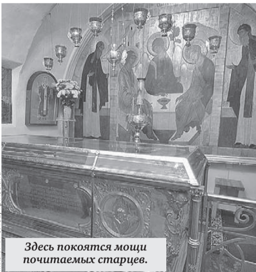
Здесь покоятся мощи почитаемых старцев.