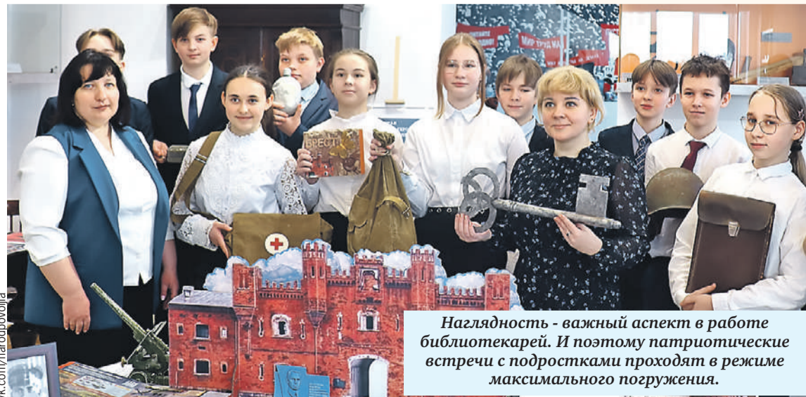
Наглядность - важный аспект в работе библиотекарей. И поэтому патриотические встречи с подростками проходят в режиме максимального погружения.

- Русско-белорусским братством мы назвались потому, что живем в России и от русских себя не отделяем. У нас, например, в Самарской области очень много браков с коренными народами - тут и башкиры, и татары, и чуваша, и мордва. Раньше был поселок, один-единственный, компактное местное проживание белорусов - Атамановский в Пушкинском районе. Но тоже все переженились. По последней переписи, которая проходила в ковидные времена, нас здесь осталось 3172 человека, а было больше четырнадцати тысяч! Нам бы, славянам, брать пример с мигрантов, которым сколько Аллах детей дает, за то и спасибо. Но это не значит, что белорусская культура и бело-