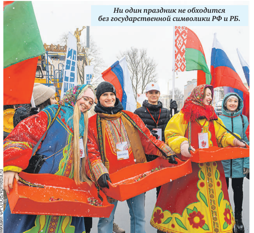
Ни один праздник не обходится без государственной символики РФ и РБ.

Сосредоточены на решении актуальных социально-экономических задач развития наиболее пострадав-