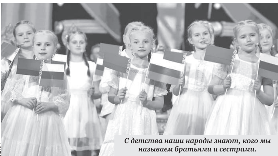
С детства наши народы знают, кого мы называем братьями и сестрами.

■ Есть такие отношения между народами и странами, которые нельзя измерить только взаимовыгодной торговлей. Они гораздо глубже и теплее.