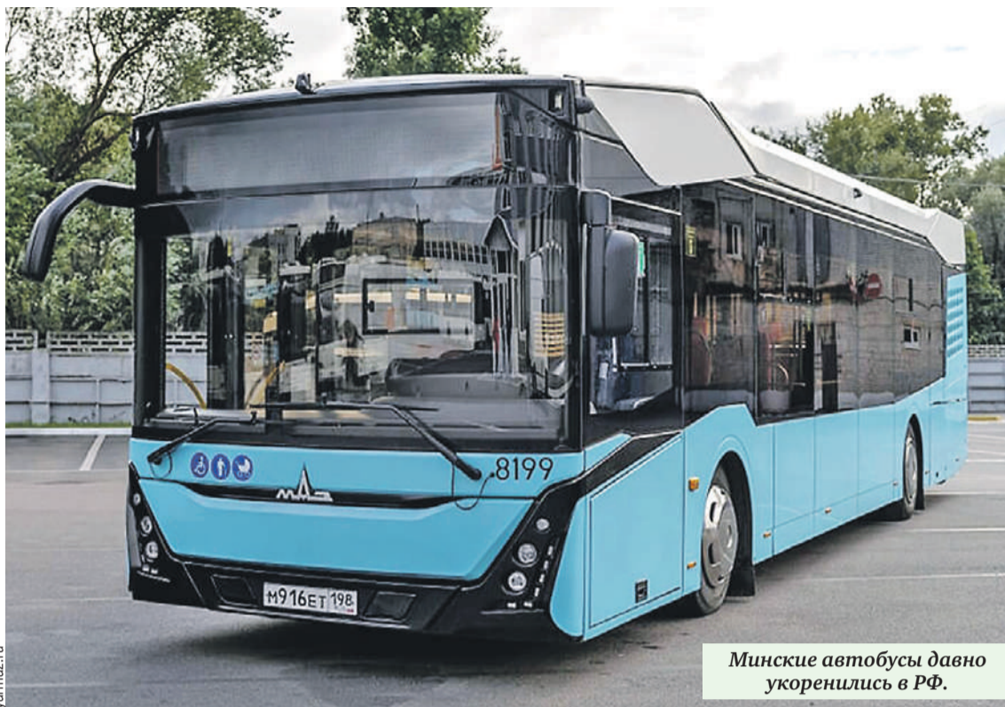
Минские автобусы давно укоренились в РФ.

только для равнин, съездите во Владивосток, где перепад высот достигает 120 метров. Местное муниципальное предприятие «ВПОПАТ № 1» всерьез сделало ставку на Минский автозавод. В 2025 году автопарк пополнился 46 автобусами «МАЗ» среднего и большого классов.