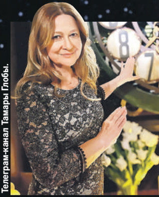
Telegram-канал Тамары Глобы.