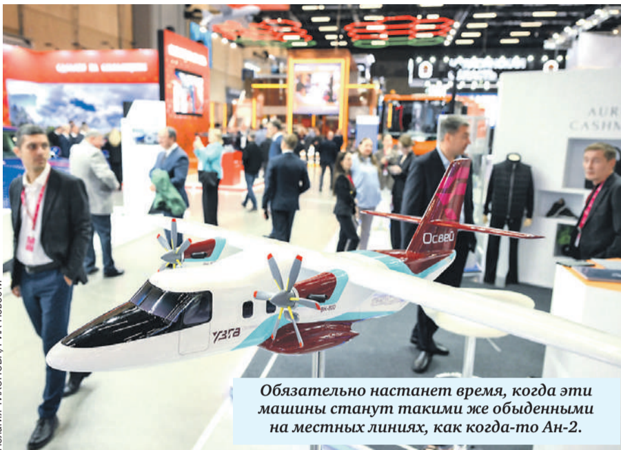
Обязательно настанет время, когда эти машины станут такими же обыденными на местных линиях, как когда-то Ан-2.

Гражданское авиастроение - отрасль стратегически важная. В условиях беспрецедентных западных санкций здесь просто необходимо уйти от импортозависимости и достичь полного технологического суверенитета. «Освей» как раз решает эту задачу.