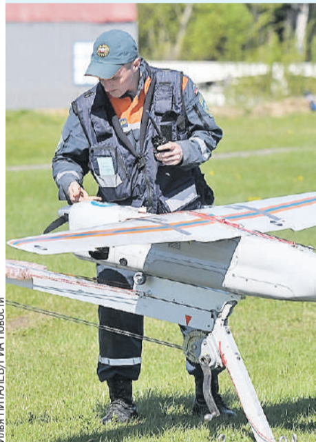
И в гражданском секторе будущее за беспилотными машинами.