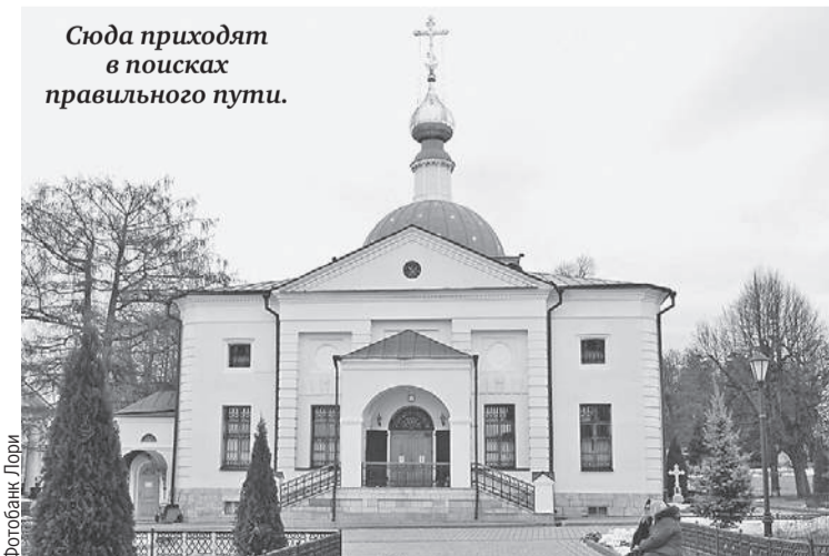
Сюда приходят в поисках правильного пути.

Паломники говорят, что здесь, в Оптиной пустыни, «небо к земле ближе».