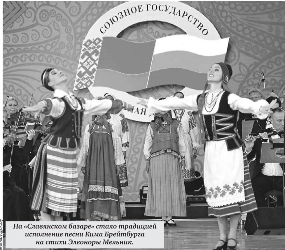
На «Славянском базаре» стало традицией исполнение песни Кима Брейтбурга на стихи Элеоноры Мельник.

праздник, как День единения народов Беларуси и России, поскольку это очередной повод сказать: две сестры - Беларусь и Россия, - заявлял композитор.