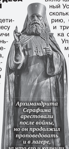
Архимандрита Серафима арестовали после войны, но он продолжил проповедовать и в лагере, за что его и казнили.

Здесь чувствуется биение сердца белорусского православия.