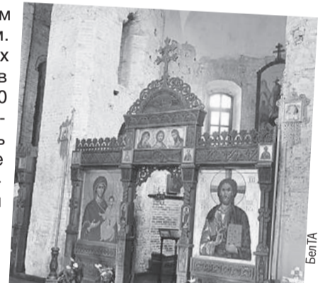
Убранство подчеркивает скромность этого древнего места.

Храм до сих пор поражает своей скромной красотой. Стены, сложенные из перемеженных валунами красных кирпичей, украшены цветными керамическими крестообразными вставками. А внутри вы не увидите ни одной колонны, что говорит о высоком мастерстве строителей. Здесь на службе можно почувствовать настоящий ход времен.