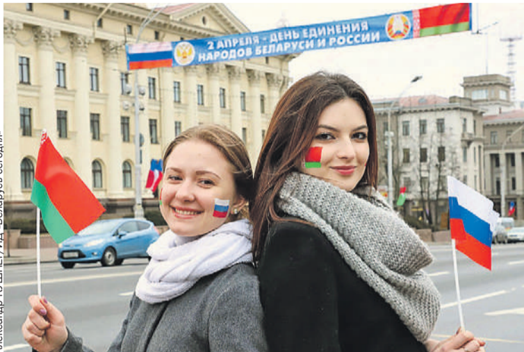
Молодые люди теперь, как и их родители, знают, что такое настоящая братская дружба.

народный форум Союзного государства «Великое наследие - общее будущее». Ежегодный фестиваль «Молодежь - за Союзное государство» расширился до формата полноценного форума.