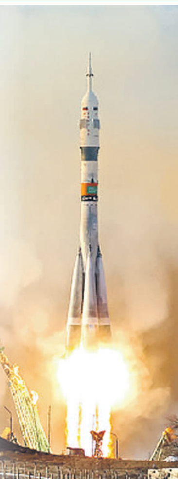
Союзное государство успешно осваивает околоземное пространство.

Достижения с белорусской стороны, например, это экспериментальный стенд для определения силы тяги малогабаритных двигателей в условиях, имитирующих космическое пространство. Он позволяет обнаруживать их «болевые точки» и дорабатывать конструкцию. Экраны на основе порошковых, композиционных и полимерных материалов защитят электронные компоненты и бортовую аппаратуру от