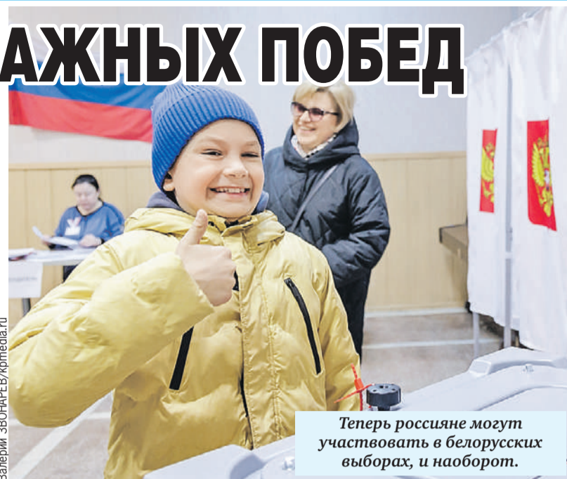
Теперь россияне могут участвовать в белорусских выборах, и наоборот.

В этом году они смогут полноправно участвовать в выборной кампании. Россияне уже обладают таким же правом в Синеокой.