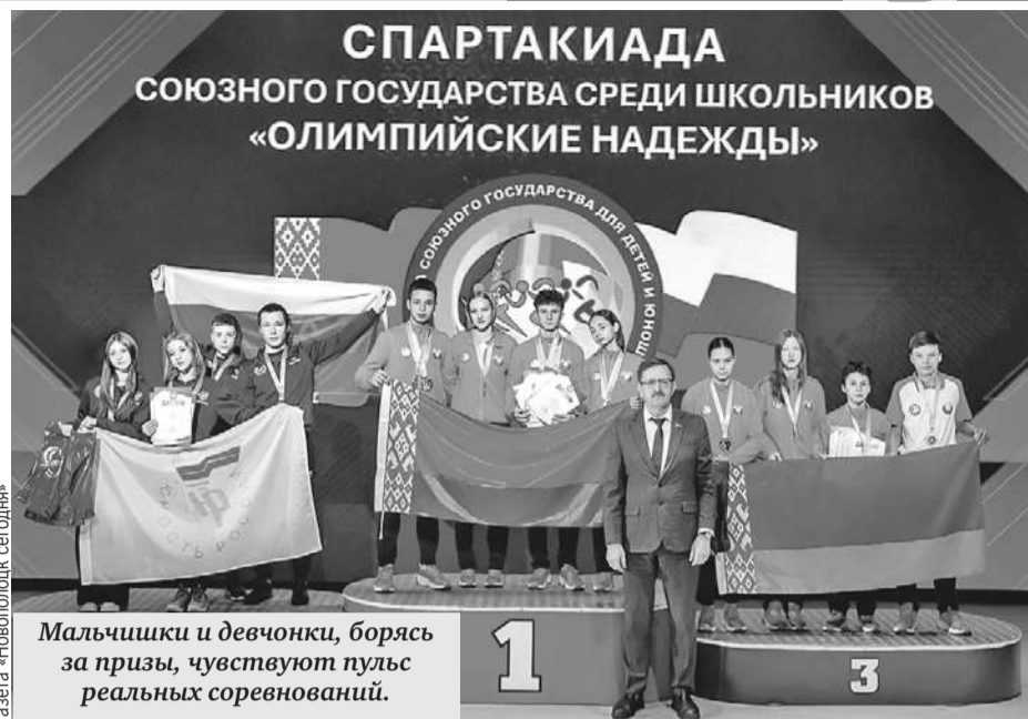
Мальчишки и девчонки, борясь за призы, чувствуют пульс реальных соревнований.