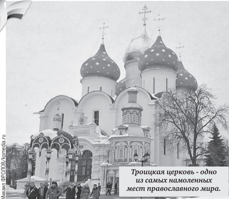
Троицкая церковь - одно из самых намоленных мест православного мира.