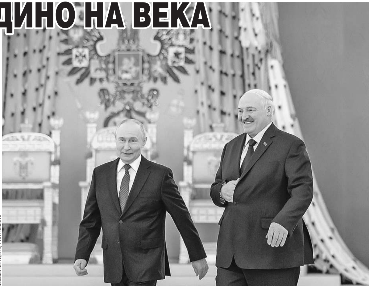
Союзная интеграция развивается как ответ на практические запросы граждан.