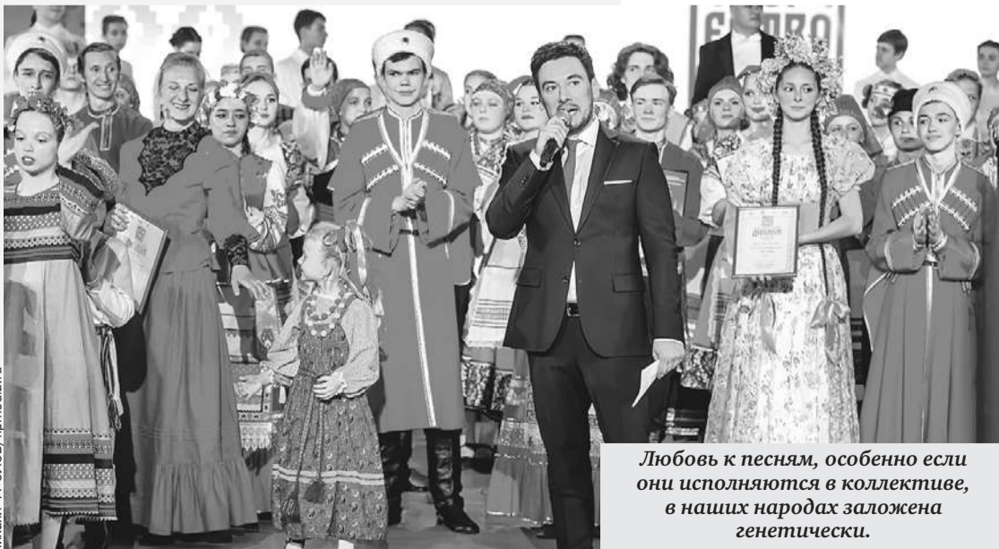
Любовь к песням, особенно если они исполняются в коллективе, в наших народах заложена генетически.

Рады будем мы друзьям! Пусть в Союз приходят к нам С доброю душой В коллектив большой, Не отнять у нас добра, Не разлучит нас судьба Потому что мы - одна Прочная страна! Припев.