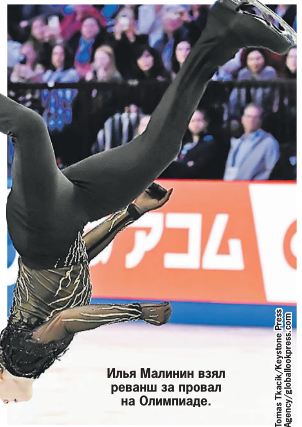
Илья Малинин взял реванш за провал на Олимпиаде.

- Да-да, все до двух минут как-то сжать, уплотнить, потому что телевизионщики жалуются, что уходят с кнопки. А для них это трагедия, у них там реклама идет.