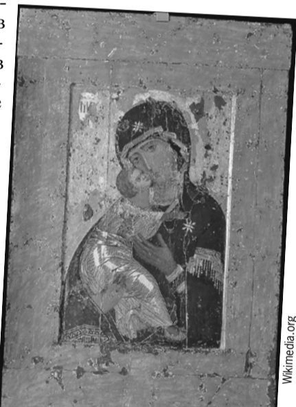
Владимирская икона Богоматери негласно считалась и считается главной - и в Древней Руси, и в современной России.

Обе иконы сейчас выставлены в храме Христа Спасителя в особых стеклянных капсулах, внутри которых поддерживается микроклимат, не дающий им разрушаться. Позже икона Божьей Ма-