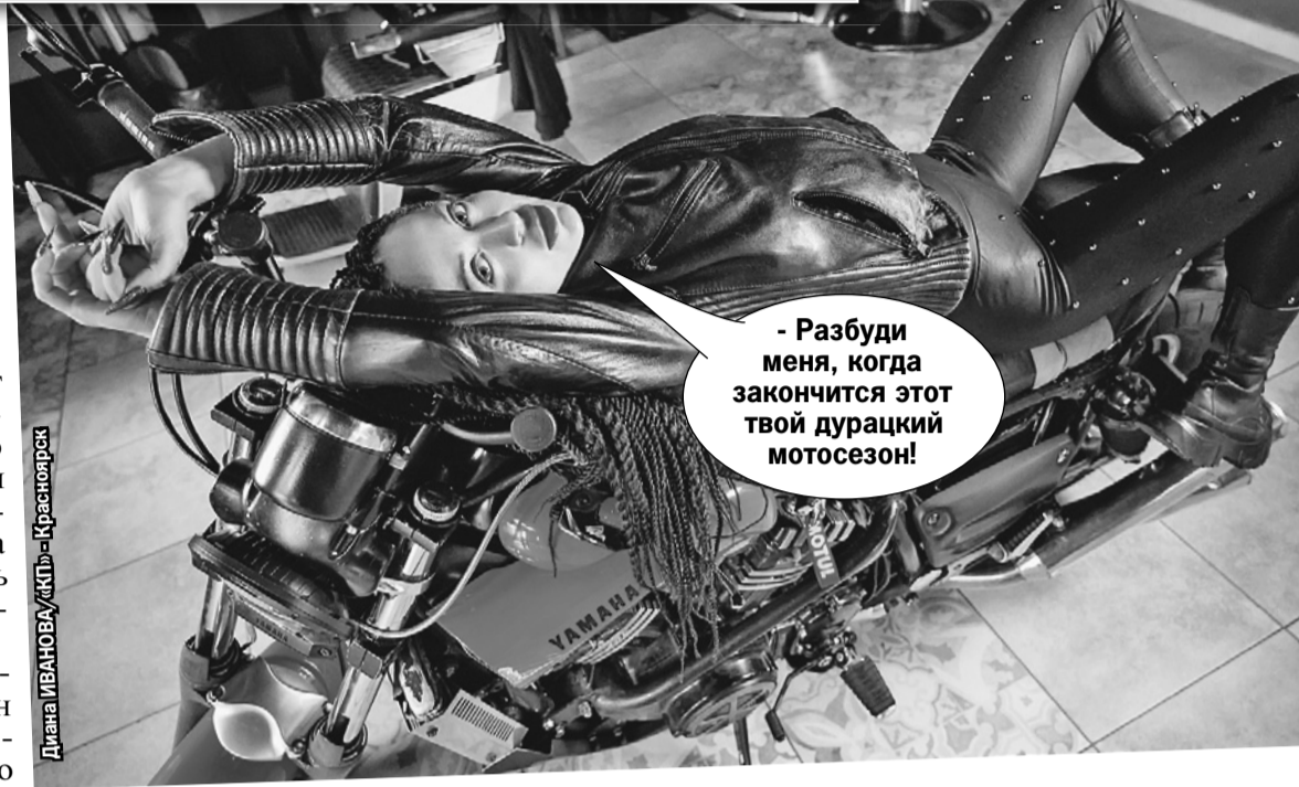
Дiana ИВАНОВА/«КР» - Красноярск

Как правильно подготовиться к новому сезону поездок на любимом байке.