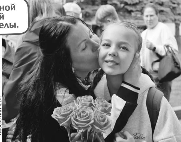
Родители теперь спокойны - их дети вернулись домой.

ходимым дорогам - там, где произошло крушение, трасс нет. Машины вязли в грязь.