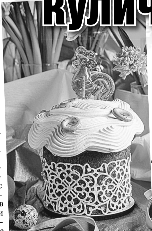
Последний писк моды пасхального декора: леденцовые петушки и сушки.

Актуальны и современные интерпретации народных мотивов: вышитые салфетки, деревянная посуда, керамика с ручной росписью. Такие детали добавят уюта и создадут ощущение тепла в праздничный день. Искусственные венки лучше заменить живыми цветами в простых вазах. Плетеные корзины и атласные ленты добавляют антуража. Но дизайнеры напоминают: важнее не количество декора, а атмосфера.