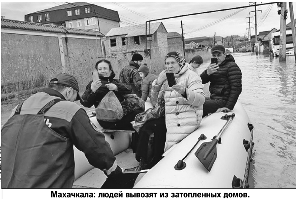
Махачкала: людей вывозят из затопленных домов.